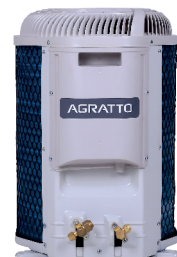
CONDENSADORA TOP DISCHARGE