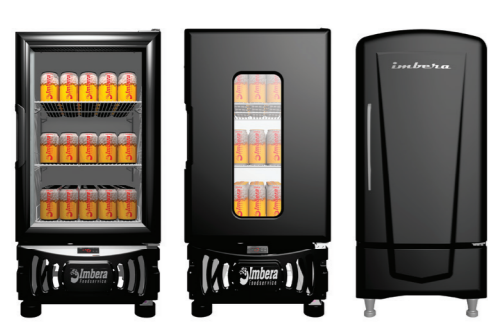
PORTA DE VIDRO CARENADO RETRO