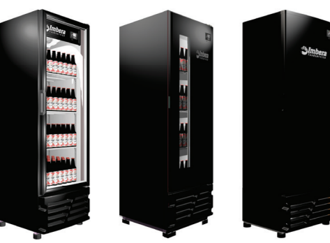
PORTA DE VIDRO PORTA WINDOW PORTA CEGA