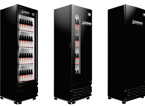
PORTA DE VIDRO PORTA WINDOW PORTA CEGA