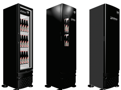
PORTA DE VIDRO PORTA WINDOW PORTA CEGA